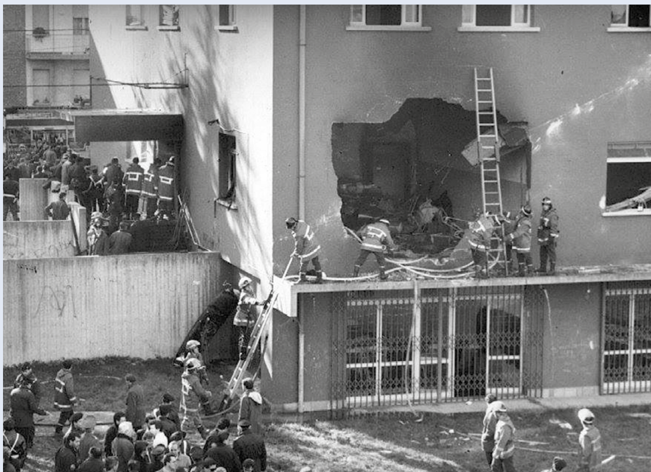
Il luogo della tragedia e i primi soccorsi.

le 25 associazioni del territorio e della Protezione civile. “La centralità data al Volontariato, all’Associazione, al ruolo della Protezione civile cui la Casa è destinata – scriveva Devani nel 2000 in qualità di Assessore comunale alla Cultura – è indicativa dell’importanza socialmente riconosciuta a chi si fa carico di gestire autonomamente servizi e attività che vanno a vantaggio di tutti i cittadini e in particolare di quelli più disagiati, dimostrando quella concreta solidarietà che ha accompagnato le vicende legate alla strage dell’Istituto Salvemini”.